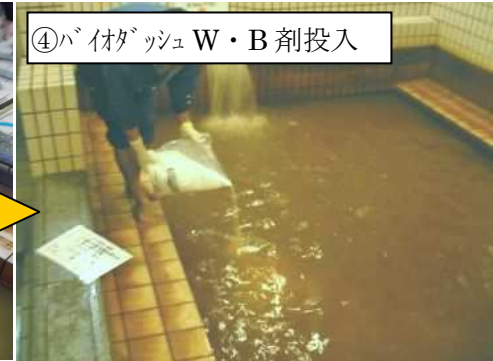
④バイオダッシュ W・B 剤投入

洗浄液を排水せず、循環しながら B 剤 を投入します。濃度は 0.6%（1m 3 あたり 6kg）B 剤を投入すると洗浄液が発泡します。