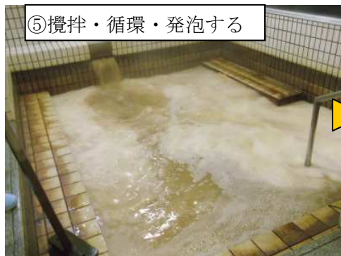
⑤攪拌・循環・発泡する

洗浄液を排水せず、循環しながら B 剤 を投入します。濃度は 0.6%（1m 3 あたり 6kg）B 剤を投入すると洗浄液が発泡します。