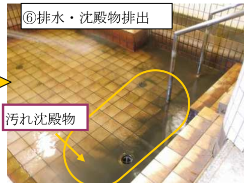
⑥排水・沈殿物排出