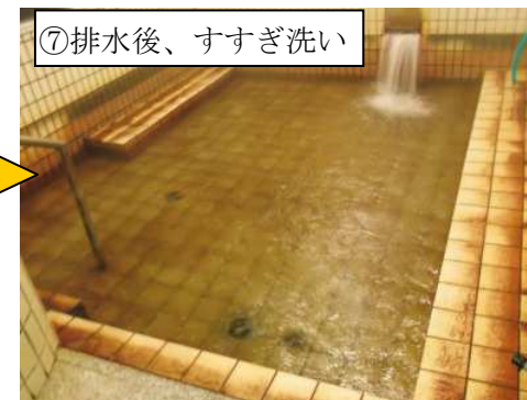
⑦排水後、すすぎ洗い

循環を止め、洗浄液を排水します。沈殿物は水道ホースで洗い流します。中和の必要はありません。