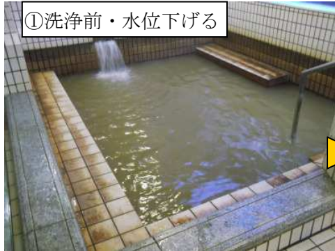
①洗浄前・水位下げる

浴槽水を循環可能な水位まで下げます。薬剂量も少なくなりますし、効果的な洗浄が可能になります。冷水でも可能ですが、温水（40℃程度）の方が効果的です。