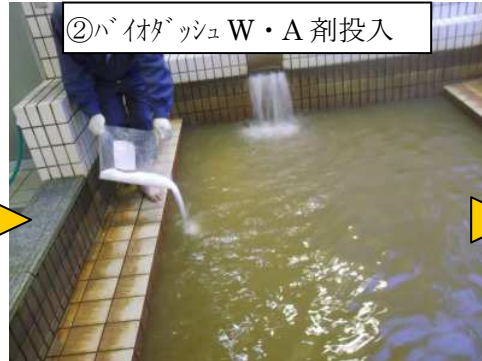
②バイオダッシュ W・A 剤投入

浴槽水を循環可能な水位まで下げます。薬剂量も少なくなりますし、効果的な洗浄が可能になります。冷水でも可能ですが、温水（40℃程度）の方が効果的です。